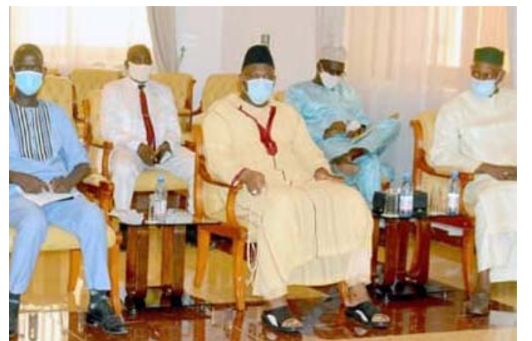
Certains membres du collectif

Selon le document, à ce niveau, il y a deux types de cas: "les candidats victorieux à l'issue des résultats provisoires proclamés par l'administration territoriale qui ont été inversés, à leur grande surprise, lors de la proclamation définitive par la Cour Constitutionnelle (des renversements de tendance au profit du parti au pouvoir) et les candidats dont les requêtes