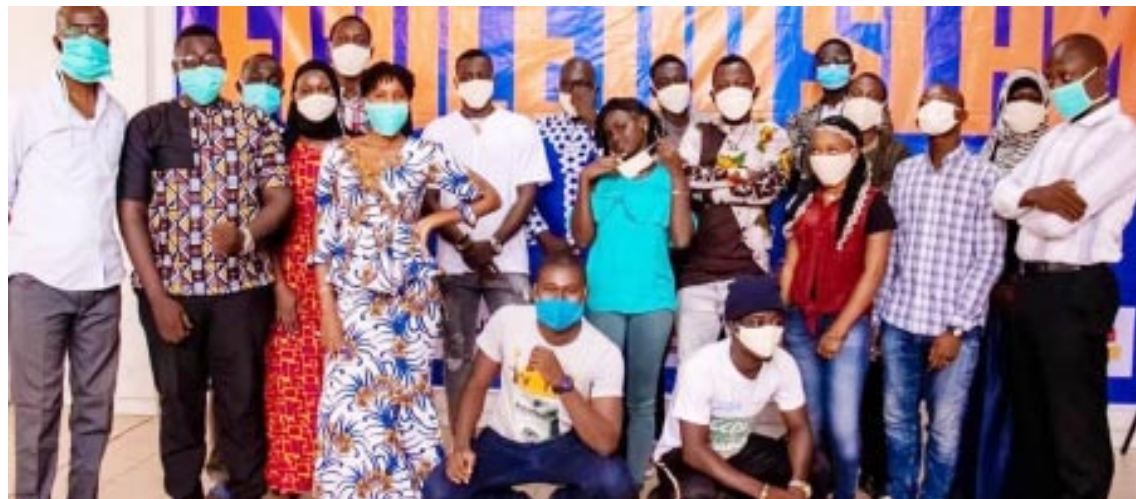
Les responsables de Jeunesse'Art lors après le casting

L'ouverture de cette 4ème édition est prévue, le lundi 20 juillet, au Lycée Ahmed Baba de Sébénicoro, en commune IV du district de Bamako. Pour la circonstance, l'Association jeunesse'art a procédé, le samedi 11 juillet dernier, au casting des postulants à la Bibliothèque nationale de Bamako.