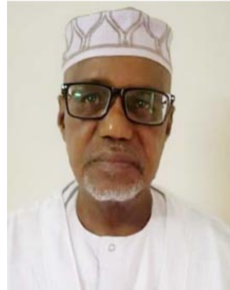
● Par Mahamadou Dallo MAÏGA*

ne peut sombrer. Communauté Internationale, aidez-nous à sauver le Mali ! Le Mali est au bord de l'abîme. Les enfants du Mali, enfants de belles civilisations et de belles cultures, ne peuvent accepter cette forfaiture et l'abandon du pays.