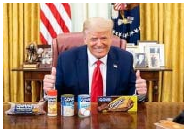
Donald Trump pose avec des produits de la marque Goya sur Instagram

Donald Trump et sa fille Ivanka ont ces derniers jours publié des photos où ils posent avec des produits de la marque Goya. Ce coup de pouce intervient quelques jours après que le patron de l'entreprise a loué l'action du président américain.