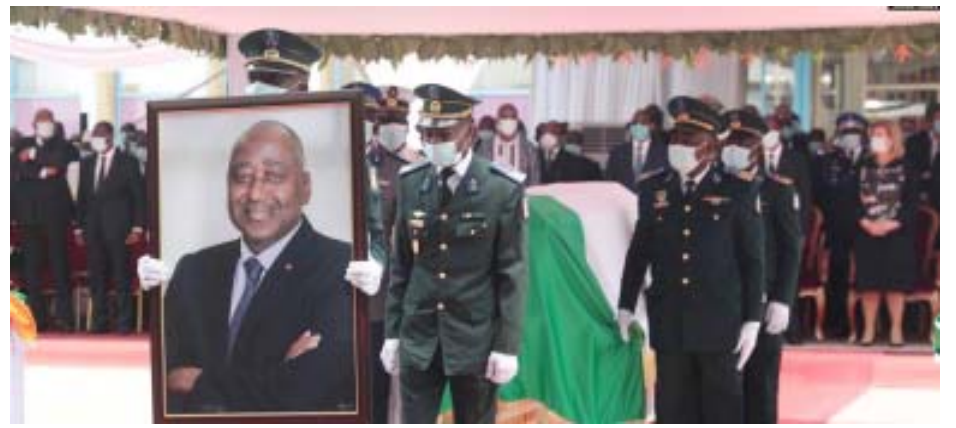
Service commémoratif et hommage au Premier ministre ivoirien Amadou Gon Coulibaly à Abidjan