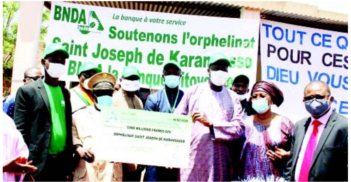
Une vue de la cérémonie remise du chèque symbolique aux responsables de l'orphelinat