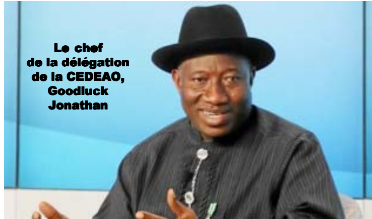
Le chef de la délégation de la CEDEAO, Goodluck Jonathan

A Bamako depuis mercredi soir, la Mission de la CEDEAO, conduite par l'ex-président nigérian, Goodluck Jonathan, a entamé, hier jeudi, ses séances de travail en vue de trouver une issue à la crise socio-politique et institutionnelle qui secoue le Mali. En désaccord persistant avec le M5-RFP, elle tentera, ce vendredi, une ultime rencontre commune, inédite et décisive avec le M5-RFP et la Majorité présidentielle.