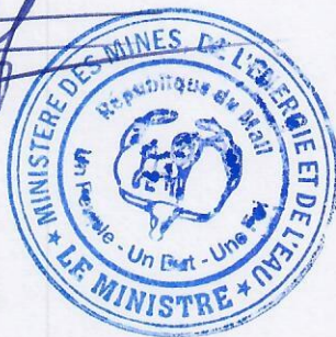
Lamine Seydou TRAORE

POUR LA SOCIÉTÉ BLUE SKY NEGOCE GOLD MALI SA