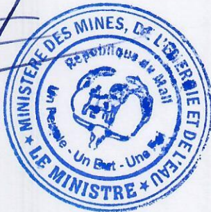
Lamine Seydou TRAORE Chevalier de l'Ordre National

LE MINISTRE DES MINES, DE L'ÉNERGIE ET DE L'EAU