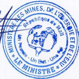
Lamine Seydou TRAORE Chevalier de l'Ordre National

LE MINISTRE DES MINES, DE L'ÉNERGIE ET DE L'EAU